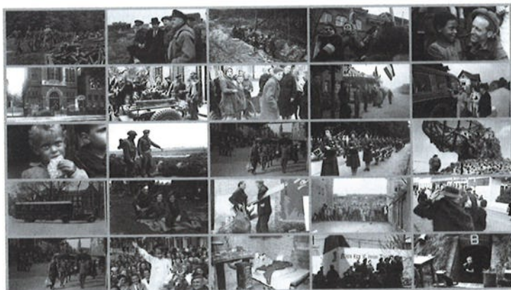
Een collage van foto's van Menno Huizinga, in het publieke domein gepubliceerd in het WO2 Open Data Depot.

Uit de op dit moment 600.000 toegevoegde namenrecords van overleden personen zijn na matching circa 300.000 individuen te onderscheiden. Wat het oplevert is de weergave van gebeurtenissen in iemands leven tijdens de Tweede Wereldoorlog, gereconstrueerd uit verschillende bronnen.