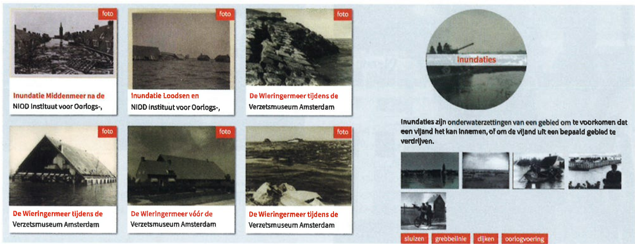
De knowledge-graph op Oorlogsbronnen.nl. Gevisualiseerde thesaurusconcepten.

corebusiness van het Netwerk Oorlogsbronnen niet alleen het 'harvesten' van relevante data, maar ook het verrijken ervan met bestaande referentiedata. We zijn van thematische aggregator naar een thematisch netwerk gegroeid. Voorheen waren in Oorlogsbronnen.nl collecties als losse containers naast elkaar te doorzoeken. De afgelopen jaren hebben we gezocht naar manieren om uit die collecties informatiesoorten te definiëren en deze aan elkaar te verbinden. Op deze manier creëren we een toegang tot wie, wat, waar en wanneer. Door het betekenisvol verbinden van de individuele collecties worden gebruikers beter verwezen naar de bronnen waar ze naar op zoek zijn. Met de ingebruikname van dit concept voor het intellectueel beheer van collecties is een volautomatische manier gevonden binnen een linked data-omgeving. Op dit moment zijn meer dan tien miljoen foto's, archiefbeschrijvingen, krantenartikelen, objecten, boeken, kunstwerken, monumenten, dagboeken, video's en meer uit de Tweede Wereldoorlog in Nederland opgenomen in Oorlogsbronnen.nl.