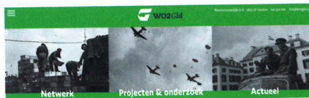
De website WO2GLD.nl is zichtbaar een zusje van Oorlogsbronnen.nl.

Om de kloof tussen de WO2-collecties van erfgoed en herinneringsorganisaties en de eindgebruiker te overbruggen, is de