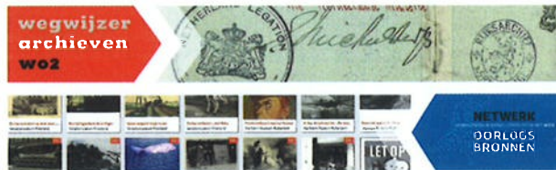
Van ArchievenWO2.nl naar Oorlogsbronnen.nl.

Bijna iedere organisatie heeft of kent ze wel: verweerde websites. Vredige rustplaatsen van waardevolle informatie die lange tijd