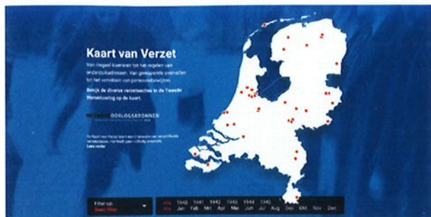
De online Kaart van Verzet.

Dan wordt onderzocht of de verrijkte data ook daadwerkelijk nieuwe kennis zal opleveren.