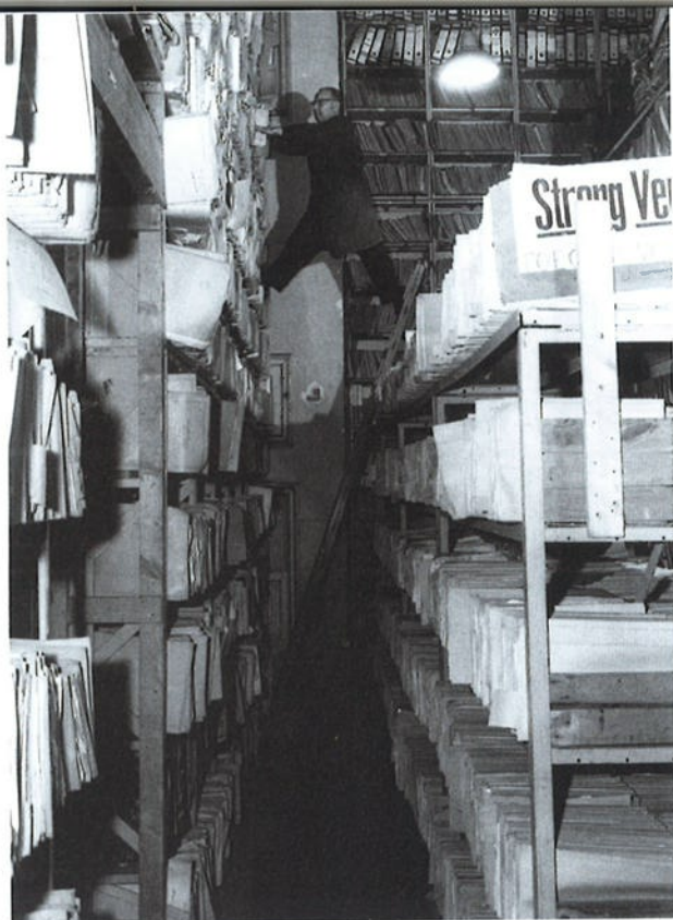
Zoeken door CABR-dossiers.

>> contextualiseren. Samen met het Netwerk Digitaal Erfgoed voert het Netwerk Oorlogsbronnen een project uit waarbij deze theorie in de praktijk wordt gebracht.