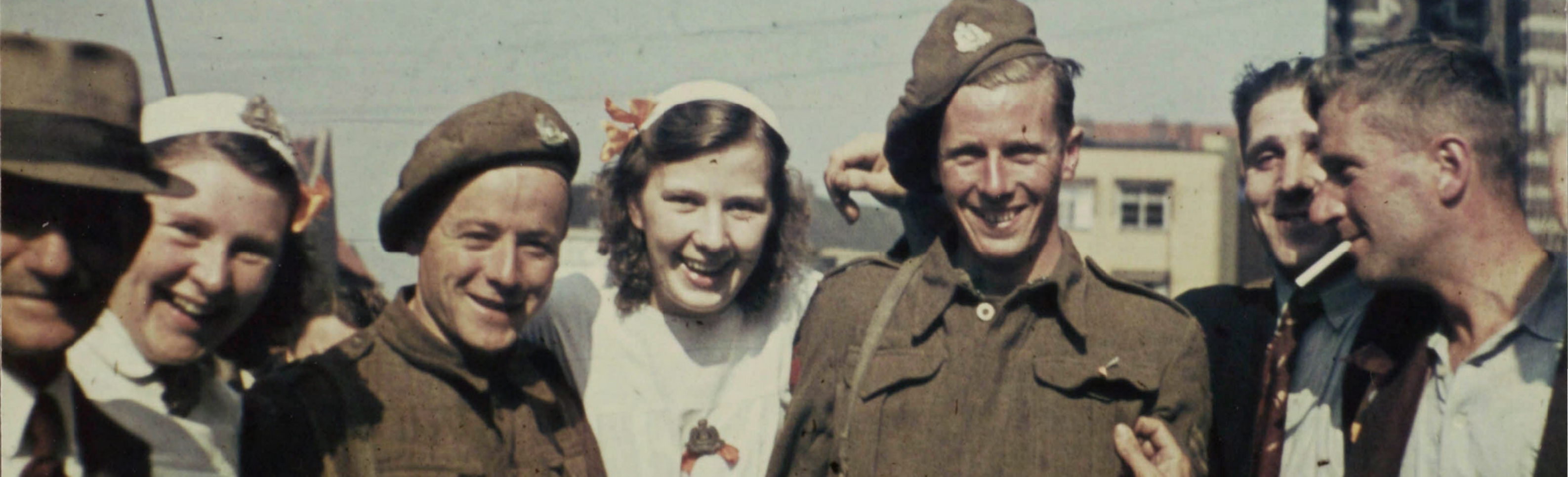
Weerter burgers en hun bevrijders op de Markt te Weert.